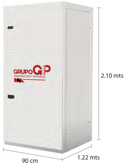
TABLERO DE CONTROL Y TRANSFERENCIA MCA GP TIPO AUTOSOPORTADO MODELO GP-D TIPO NEMA1

El tablero de transferencia automático (alojado en gabinete ciego tipo NEMA1) modelo GP-300 (220V) formado por ATS doble tiro 1000 Amp. marca Suntree, tiene la función de hacer la transferencia y retransferencia de la carga de la red de CFE a la planta y viceversa, todo esto de forma automática o manual.