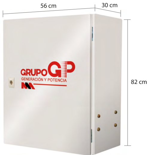
TABLERO DE TRANSFERENCIA MCA GP MODELO GP-A TIPO NEMA1

El tablero de transferencia automático (alojado en gabinete ciego tipo NEMA1) modelo GP-20 (220V) formado por transferencia doble tiro para 70 Amp. tiene la función de hacer la transferencia y retransferencia de la carga de la red de CFE a la planta y viceversa. Todo esto de forma automática o manual.