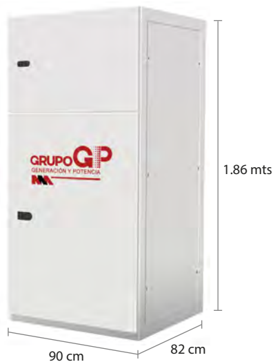
TABLERO DE CONTROL Y TRANSFERENCIA MCA GP SIEGO A PIE DE GENERADOR MODELO GP-C TIPO NEMA1

El tablero de transferencia automático (alojado en gabinete ciego tipo NEMA1) modelo GP-100 (220V) formado por contactores magnéticos de 350 Amp. tiene la función de hacer la transferencia y retransferencia de la carga de la red de CFE a la planta y viceversa, todo esto de forma automática o manual.