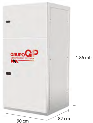
TABLERO DE CONTROL Y TRANSFERENCIA MCA GP CIEGO A PIE DE GENERADOR MODELO GP-C TIPO NEMA1

El tablero de transferencia automático (alojado en gabinete ciego tipo NEMA1) modelo GP-200 (220V) con ATS doble tiro de 630 Amp. tiene la función de hacer la transferencia y retransferencia de la carga de la red de CFE a la planta y viceversa, todo esto de forma automática o manual.