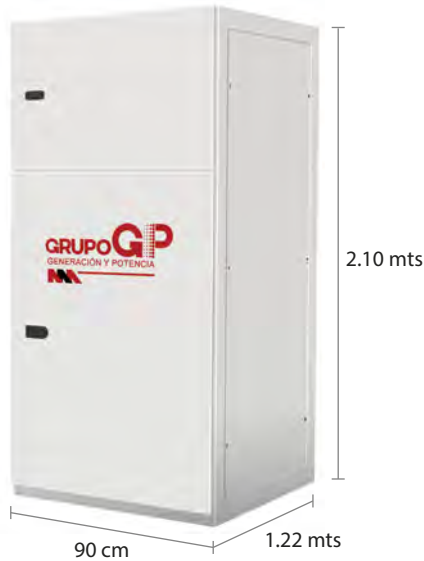
TABLERO DE CONTROL Y TRANSFERENCIA MCA GP TIPO AUTOSOPORTADO MODELO GP-D TIPO NEMA1

El tablero de transferencia automática (alojado en gabinete ciego tipo NEMA1) modelo GP-400 (220V) con ATS doble tiro de 1250 Amp. tiene la función de hacer la transferencia y retransferencia de la carga de la red de CFE a la planta y viceversa, todo esto de forma automática o manual.