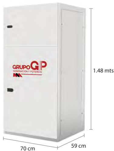
TABLERO DE CONTROL Y TRANSFERENCIA MCA GP CIEGO A PIE DE GENERADOR MODELO GP-B TIPO NEMA1

El tablero de transferencia automático (alojado en gabinete ciego tipo NEMA1) modelo GP-80 (220V) formado por transferencia ATS doble tiro de 275 Amp. tiene la función de hacer la transferencia y retransferencia de la carga de la red de CFE a la planta y viceversa, todo esto de forma automática o manual.