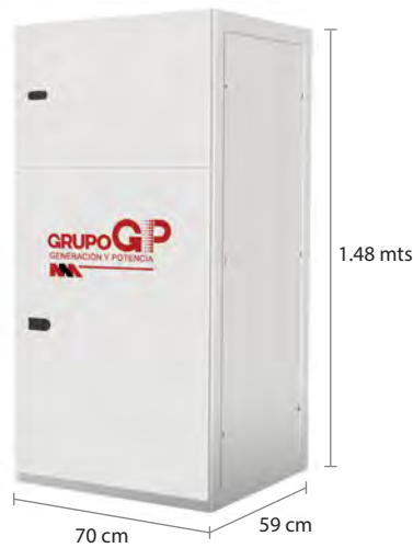
TABLERO DE CONTROL Y TRANSFERENCIA MCA GP CIEGO A PIE DE GENERADOR MODELO GP-B TIPO NEMA1

El tablero de transferencia automático alojado en gabinete ciego tipo NEMA1) modelo GP-60 (220V) formado por transferencia ATS doble tiro de 200 Amp. tiene la función de arrancar, parar, proteger tanto el motor diesel como el generador eléctrico y hacer la transferencia y retransferencia de la carga de la red de CFE a la planta y viceversa, todo esto de forma automática o manual.