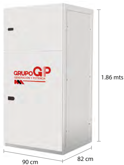
TABLERO DE CONTROL Y TRANSFERENCIA MCA GP CIEGO A PIE DE GENERADOR MODELO GP-C TIPO NEMA1

El tablero de transferencia automática (alojado en gabinete ciego tipo NEMA1) modelo GP-175 (220V) con ATS 630 Amp. doble tiro, tiene la función de hacer la transferencia y retransferencia de la carga de la red de CFE a la planta y viceversa, todo esto de forma automática o manual.