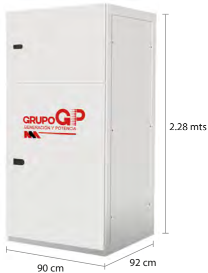
TABLERO DE CONTROL Y TRANSFERENCIA MCA GP TIPO AUTOSOPORTADO MODELO GP- E TIPO NEMA1

El tablero de transferencia automático (alojado en gabinete ciego tipo NEMA1) modelo GP-1250 (440 V) con ATS doble tiro de 4000 Amp. tiene la función de hacer la transferencia y retransferencia de la carga de la red de CFE a la planta y viceversa, todo esto de forma automática o manual.